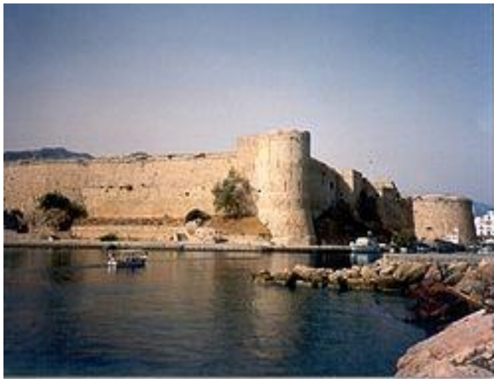
Το Κάστρο της Κερύνειας