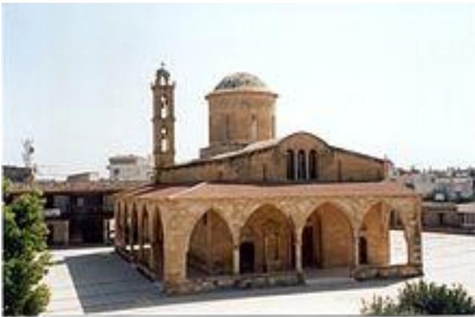
Ο Άγιος Μάμας στη Μόρφου

Η Μόρφου είναι κωμόπολη της επαρχίας Λευκωσίας . Βρίσκεται στα δυτικά του νησιού σε υψόμετρο 65 μέτρα και έχει έκταση 5.636 εκτάρια. Το 1974 η πόλη καταλήφθηκε από του Τούρκους και σήμερα είναι κατεχόμενη . Η πόλη ήταν γνωστή για τα εσπεριδοειδή της και κυρίως τους πορτοκαλεώνες της. Κάθε χρόνο μάλιστα γινόταν , όπως και στην Αμμόχωστο , η γιορτή πορτοκαλιού που διαρκούσε δύο εβδομάδες.