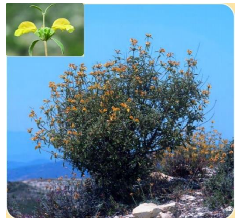
Πηγές: Τμήμα Δασών Το Κόκκινο βιβλίο της χλωρίδας της Κύπρου

Θάμνος ύψους μέχρι 1,5m και ανθίζει από τον Μάιο μέχρι τον Ιούνιο. Έχει έντονα κίτρινα άνθη. Το συναντούμε στο νότιο μέρος της οροσειράς του Τροόδους και στο ανατολικό μέρος της οροσειράς του Πενταδακτύλου σε υψόμετρο 100-900m σε περιοχές με ασβεστολιθικά πετρώματα. Έχει περιορισμένη εξάπλωση.